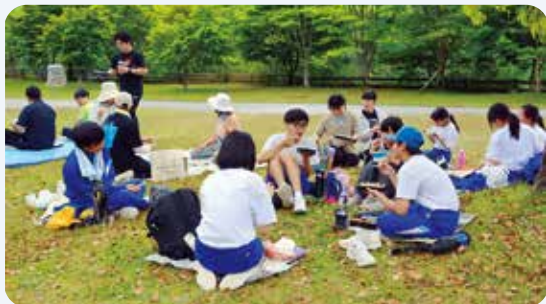
5月16日 春の遠足(魚梁瀬小・中学校)