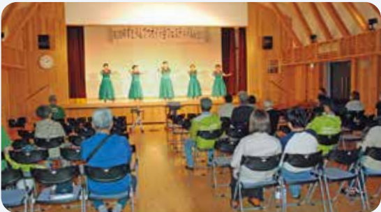
5月24日 ゆずとりんてつガイド会フェスティバル(集会センターうまなび)