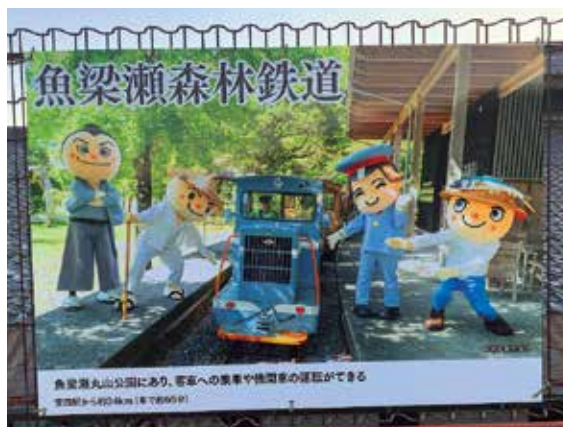
魚梁瀬森林鉄道(安田駅ホーム)