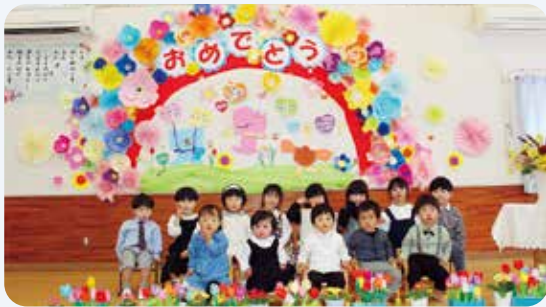
4月4日 馬路保育所入園式(馬路保育所)