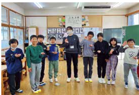
▲学校で子どもたちと一緒に