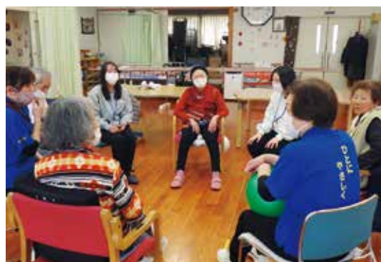
▲デイサービスで体験