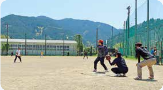
4月26日 職域ソフトボール大会(村民運動場)