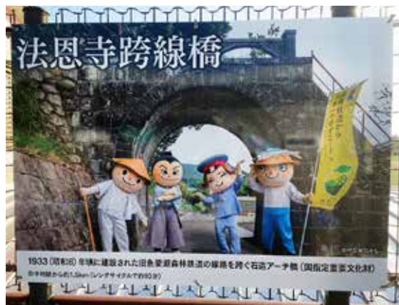
法恩寺跨線橋(奈半利駅ホーム)