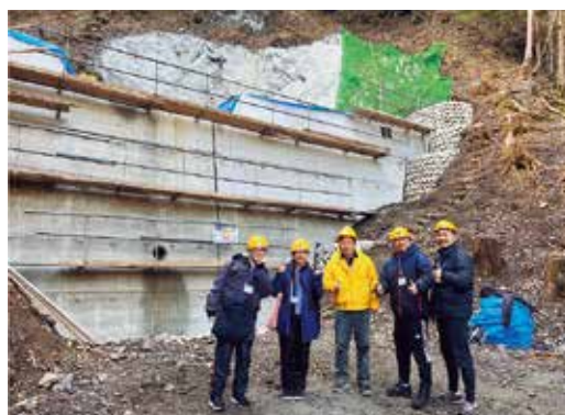
▲土木作業の現場を見学

将来、医師、看護師等の医療従事者となる学生たちにとっては、地域の人々を知り、暮らしを知ることは、地域医療を行う上で非常に重要です。 今回の経験や感じたことを忘れず、患者に寄り添える医療従事者を目指してもらいたいです。そして、将来本村の医療に関わってくれることを期待したいと思います。 今回お世話になりました住民の皆さん、村内事業所の皆さん、年度末のお忙しい時期にご協力をいただき、ありがとうございました。