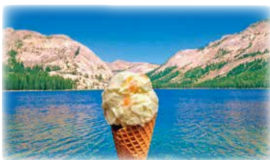
▲ホーキーボーキー味のアイスクリーム

のハチミツやマスカハニー、キウイフルーツ、そしてホーキーボーキー（キャラメル風味のハニカムトフィーを砕いたもの）があります。特にホーキーボーキーは、ニュージーランドならではのユニークな味として、観光客にも愛されています。都市部では、オークランドの「ジャスト・アイスクリーム」やクイーンズタウンの「パタゴニア・チョコレート」など、手作りにこだわったアイスを提供する店が人気です。一方、田舎町では、地元の小さなアイスクリームスタンドが、新鮮な素材を使ったシンプルなおいしさを提供しています。