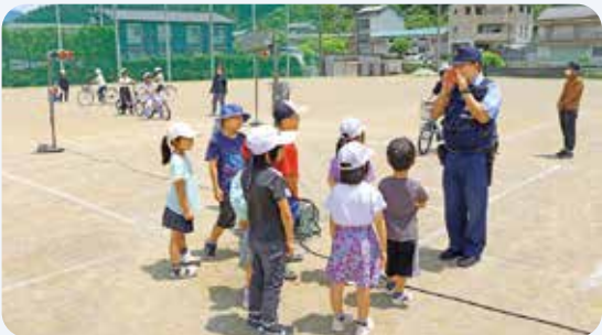
5月23日 交通安全教室(馬路小学校)