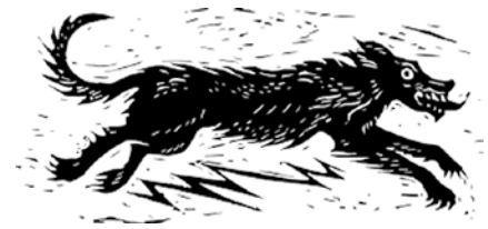
▲ブラックシャック

ハロウィンが近づくこの時期、私の地域に伝わる幽霊の話「ブラックシャック」を紹介したいと思います。「ブラックシャック」は、野生でふさふさした黒い毛に覆われた幽霊のような犬で、その大きさは人の肩から馬の大きさまでさまざまです。目は地獄の炎のように赤く燃えています。最も有名な話は、1577年にサフォーク州バンゲイで起こったものです。