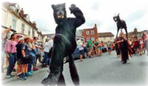
▲ブラックシャック祭りの様子

その村の教会で嵐の中、集会が行われていました。村人たちは祈りを捧げて膝をついていた時、大きな木の扉が砲弾のような音で叩かれました。扉が雷鳴と共に開くと、巨大な黒い犬が突進してきました。その犬の足は炎に包まれており、ネイブを駆ける際には床に焦げ跡を残しました。ネイブの端には、祈っていた男とその息子がいましたが、ブラックシャックは一瞬のうちに二人をその牙にかけて命を奪いました。他の村人たちは何もできず、その瞬間、屋根が眩しい雷に打たれ、炎に包まれて、教会の内部に崩れ落ちました。これがブラックシャックの話の結末です。