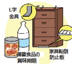
日頃からの備えの再確認