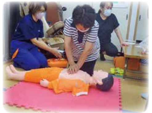
▲子どもの人形で心臓マッサージを体験