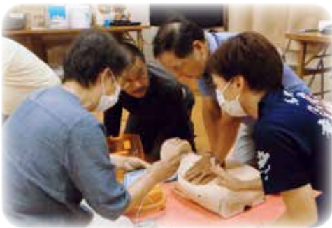
▲消防団員さんに心臓マッサージのコツを教えてくださいました