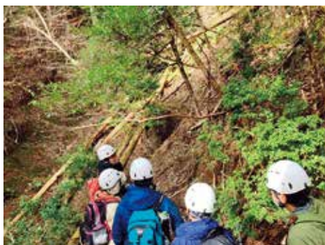
森林鉄道軌道跡トレッキング