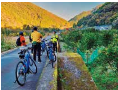
Eバイクガイドツアー