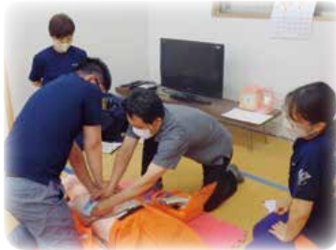
▲AEDのパッドをつける間も心臓マッサージを続けます