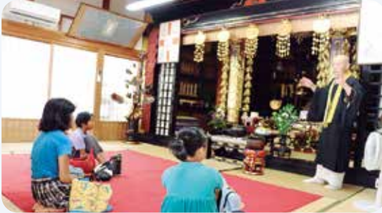
8月1日 夏休み子ども体験教室「金林寺文化財とお茶会」(金林寺)