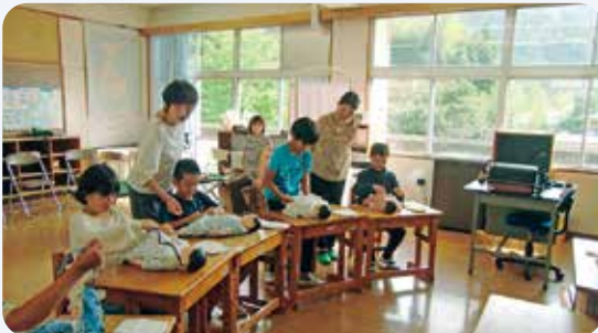
9月25日 いのちの学習(馬路小学校)