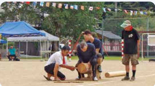
9月28日 魚梁瀬小中学校・魚梁瀬地区民合同大運動会(魚梁瀬小中学校運動場)