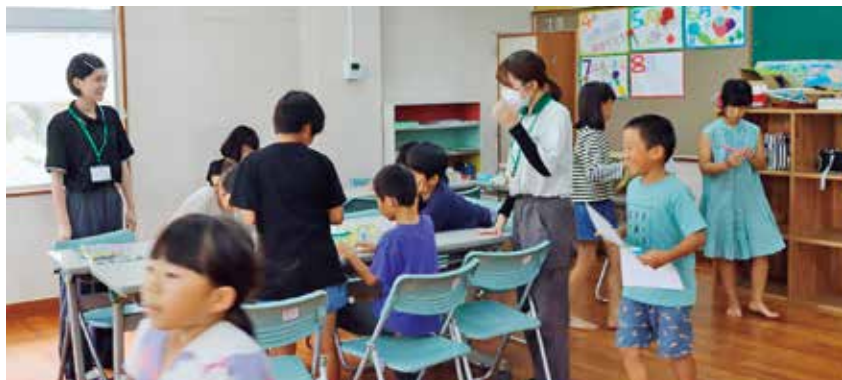
▲子どもたちと一緒に避難所運営のシミュレーション

放課後子ども教室と違い、夏休みは時間がたっぷり。子どもたちとの遊びあり、運動あり、避難訓練ありの盛りだくさんの日々が過ぎていきました。