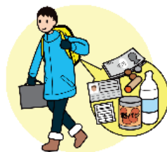
非常持出品の常時携帯