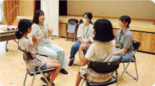
8月8日 半熟たまご塾(馬路村集会センターうまなび)