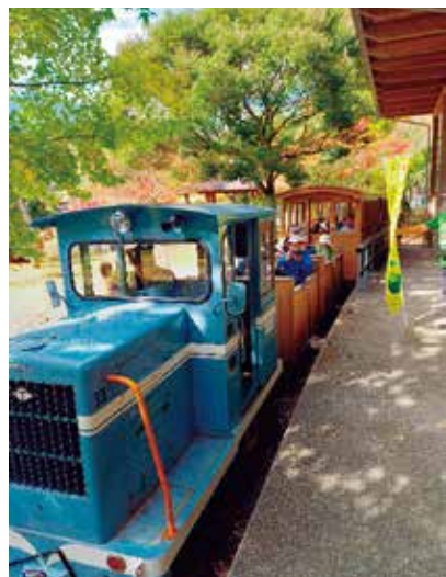
森林鉄道乗車体験