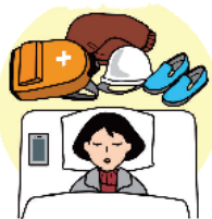
すぐに逃げられる態勢での就寝

家具の固定や安全な避難場所・避難経路の確認などの 平時からの地震への備えの再確認 に加え、すぐに逃げられる態勢での就寝や非常持出品を常時携帯するなど、 揺れを感じた場合に、直ちに避難できる態勢をとってください。