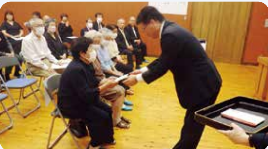
9月26日 魚梁瀬地区敬老会(魚梁瀬多目的施設)