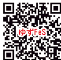
第11回ゆずFeS 予約サイト

問い合わせ先：中芸のゆずと森林鉄道日本遺産協議会事務局 (安田町役場日本遺産推進室内)