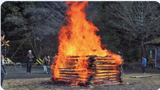
1月15日 どんど焼き(魚梁瀬丸山公園)