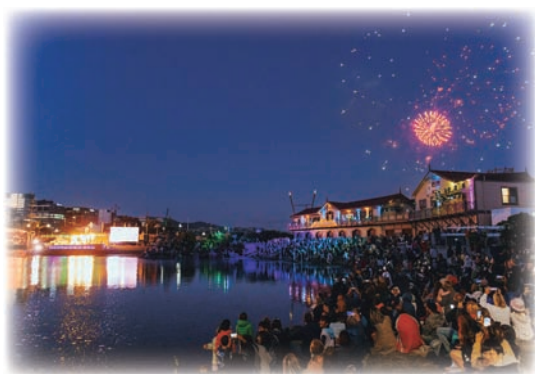
▶ウエリントン の新年フェスティバル

ニュージーランドの新年の音楽フェスティバルは、国の文化的な一部であり、新年を迎えるために欠かせないものとなっています。美しいロケーション、多様なラインナップ、開放的な雰囲気により、これらのフェスティバルは音楽愛好者やパーティー好きな人々にとって見逃せないイベントとなっています。