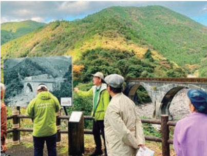
受講風景と現地ガイド風景