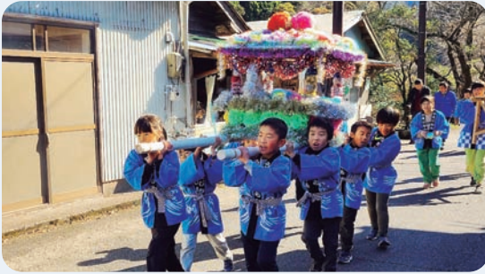
12月2日 こども神輿(馬路)