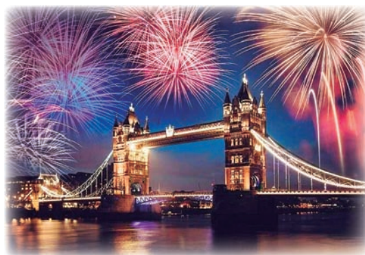
◀テムズ川の花火の様子

花火が終わると、最大100万人の大観衆がスコットランドの歌「Auld Lang Syne（昔ながらの友）」を歌います。私は、日本でも同じ曲を「蛍の光」という別の