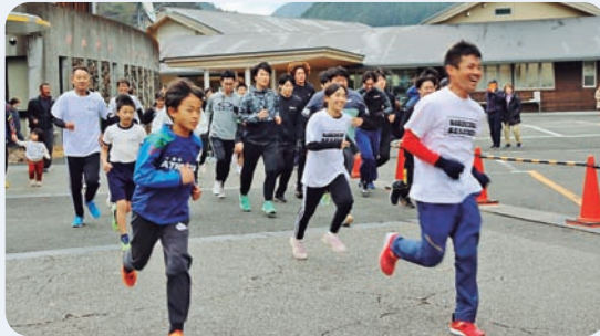
1月2日 新春走り初めピットリタイムレース(馬路)