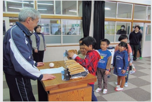
▶ 馬路小学校でのお披露目の様子