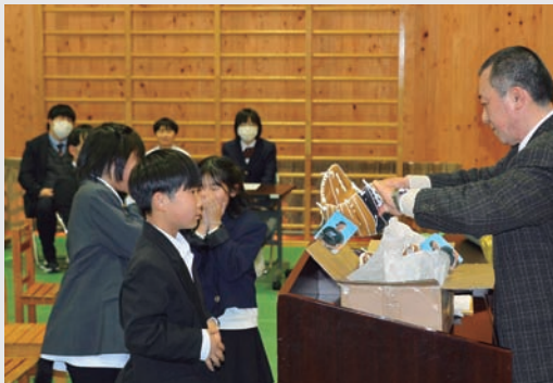
◀ 魚梁瀬小学校でのお披露目の様子