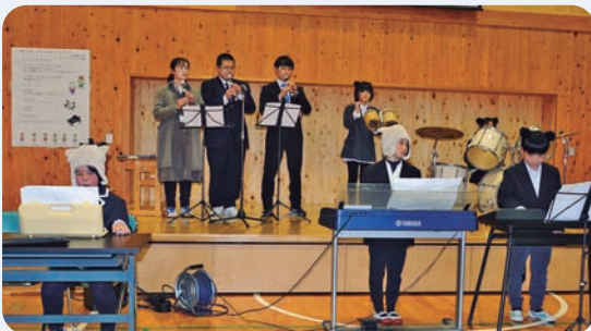
1月27日 杉の子発表会(魚梁瀬体育館)