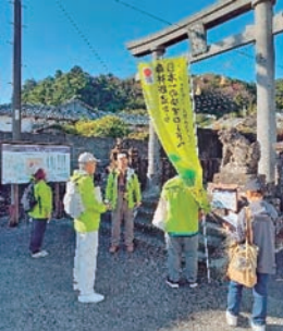
安田八幡宮(安田町)