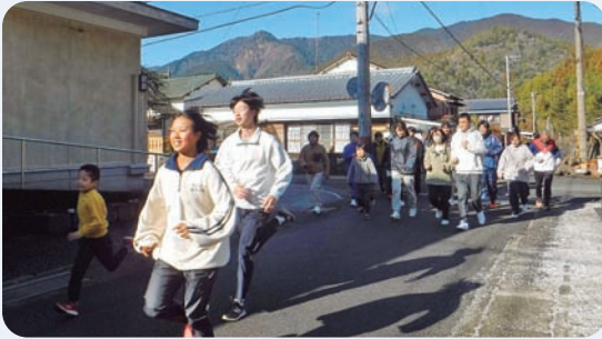
1月1日 新春走り初めピットリタイムレース(魚梁瀬)