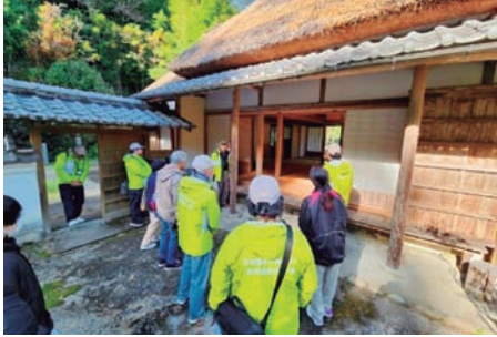
中岡慎太郎生家(北川村)