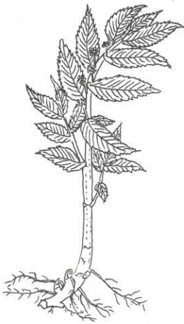
ミズナ Elatostema involucreatum Franch. et Sav.