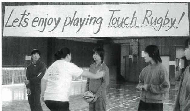
▲「タッチ!」ルールを説明する 5/18 馬路体育館にて

タッチラグビーは故郷のニュージーランドでたいへん広まっているスポーツで、私はこちらでも高知ALTタッチラグビーチームに入っているを楽しんでいます。タッチラグビーはスピードがあり刺激的なゲームで、中学生に教えられることができうれしかったです。タッチラグビーはラグビーと似ていますが、タックルはなく、タッチするだけで、各チーム6人ずつで行います。