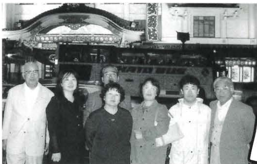
▲夜の歌舞伎座の前にて(左端が私 左から3番目が家内) 5/3

我々兄弟が都会で安心して生活できるのも、妹が馬路でしっかり家を守ってくれているおかげで、感謝しています。お盆や柚子の季節などおりにつけ帰省し、美味しい空気を味わい、元