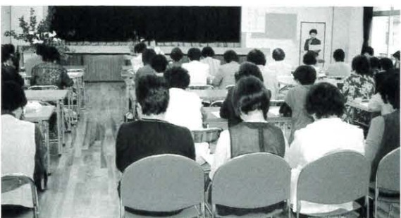
5月19日 安芸都市連合婦人会総会