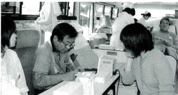
4月26日 献血（就業改善センター前）