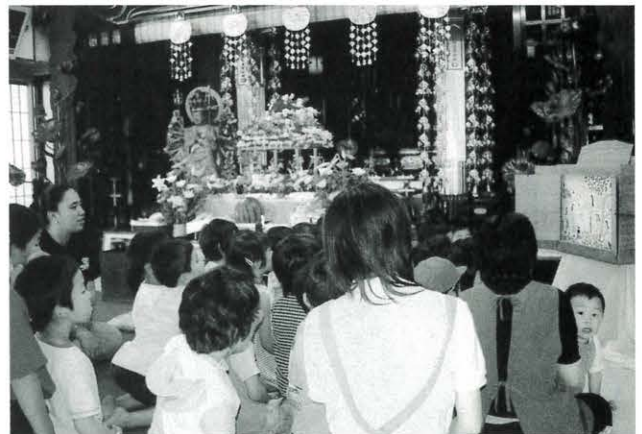
▲「花まつり」で子どもたちと一緒に紙芝居を見る 5/26 金林寺にて

「楽しい」「悲しい」「寒い」「おながすいた」を表現することを学び、子どもたちは大きなジェスチャーをし、私も一緒になって楽しく遊びました。また保育園に行く日を楽しみにしています。