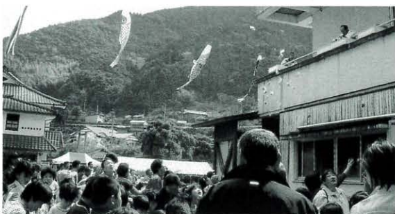
4月11日 馬路村観光開き（馬路温泉）