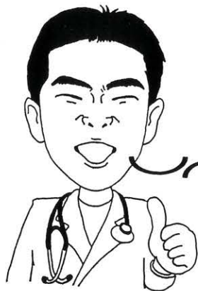
イラスト はたけなか ともこ

今回は痔(ぢ)に関する病気の説明をします。肛門の病気を持っている人は結構多いようです。