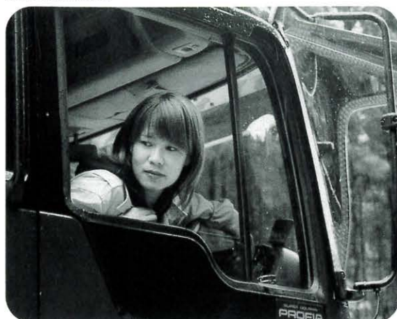
▲ 和田谷川で土砂を積む 5/20

あずき色の大型トラックをさっそうと運転するドライバー。すれちがいに「あれっ、女性だ」と思ったことはありませんか。今回は、その彼女を追って安田町の工事現場へ取材