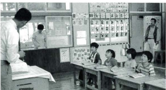
5月18日 村内小・中学校合同学習会