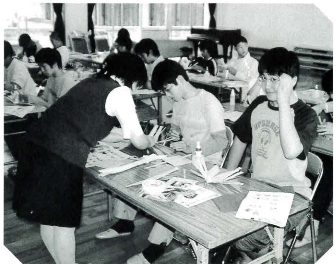
エコアス馬路村の職員に習いかなばを編む 5/25 就業改善センターにて

本年度は、あいさつ運動を中心に活動していきたいと思っています。人が人として生活していく基本である「あいさつ」をもう一度ふりかえりましょう。あなたは、家庭で、職場で、地域で気持ちよいあいさつができていますか。皆さんは、地域にどんな課題、資源があると思いませんか。どんな地域になつてほしいと思いますか。いろいろな場面を考え、話しあってみてください。関われる人が関われる時に、おせっかい、でしゃばり大歓迎です。子どもからお年寄りまで楽しんでみながら地域づくりを行っていきましよう。ご協力をよろしくお願ひします。「知恵」と「力」を貸してください。