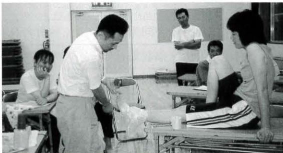
7月13日 体育会連合会研修