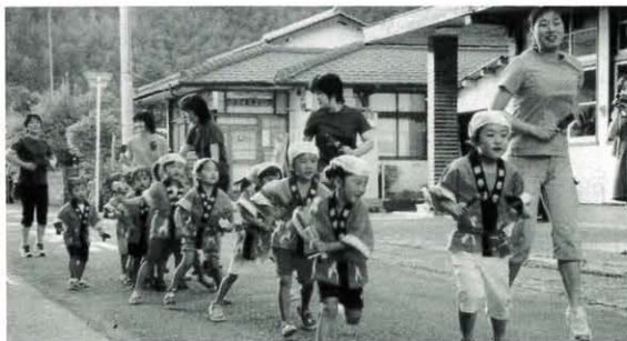
7月17日 フェスティバル魚梁瀬