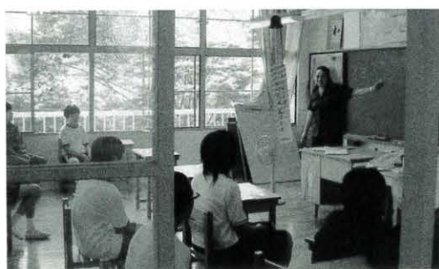
英語に集中! (魚梁瀬中学校)