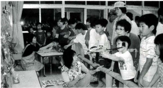
7月10日 夕涼み会（馬路保育所）