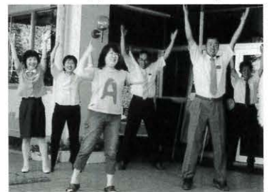
▲ 馬路村教育委員会前にて