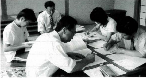
6月23日 小学校教科用図書選定調査会