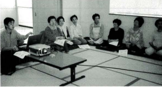
6月3日 健康教室（薬の飲み方）