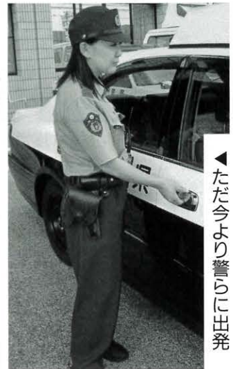
◀ただ今より警らに出発