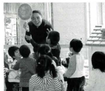
「緑(グリーン)はgo!」(馬路保育所)