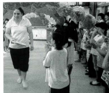
花のアーチをくぐってgood-bye (馬路小学校)