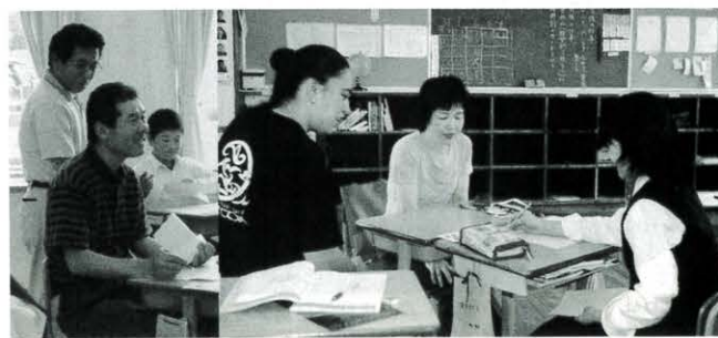
“Your English is very good!” 大人も喜ぶわくわく教室 (あなたの英語はスバラシイ!) (馬路中学校)