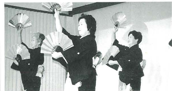
1月24日 村内芸能発表会