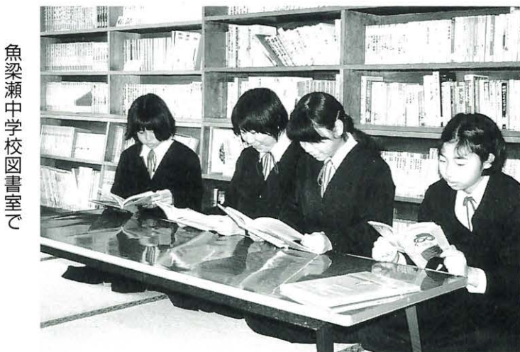
魚梁瀬中学校図書室で

優良小学校賞に馬路小学校が、優良中学校賞に馬路中学校と魚梁瀬中学校がそれぞれ選ばれました。