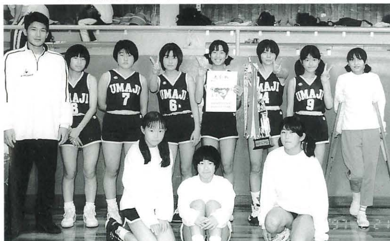
試合後優勝トロフィーを手に (安芸市民体育館)