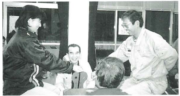
12月5日 馬路地区はし拳大会