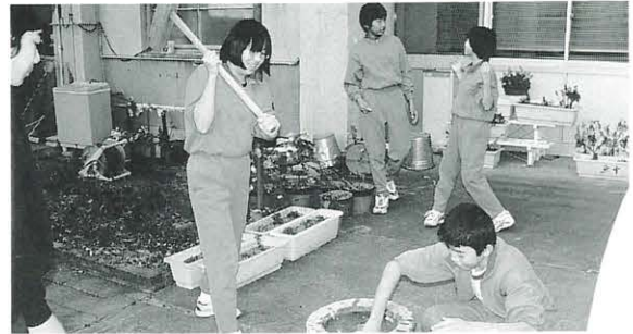
12月16日 魚梁瀬中学校もちつき大会