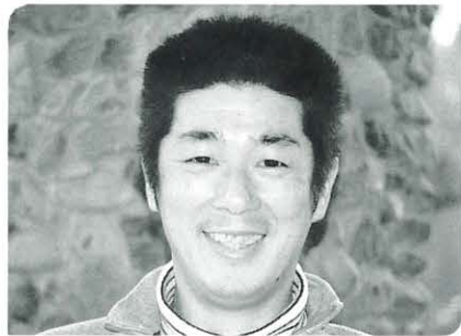
池上 永一 さん 昭和37年生 トラ年なので、何にでもトライしたい。