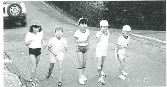
12月22日 魚梁瀬小学校マラソン大会