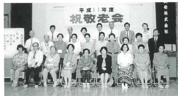
9月8日 敬老会（魚梁瀬）