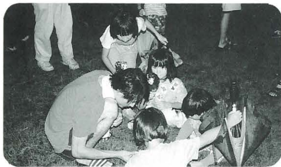
光の虫メガネ 熊野神社