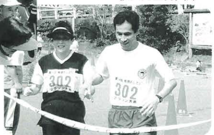
本当はフルマラソンに出たかった 竹崎校長先生御夫婦