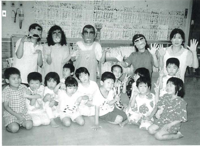
肝だめしの後で みんなで仲良くパチリ

子どもの個性や時代の要請にに応じて、保育行事の在り方を変えて行くことも大事。しかし、本当にいい行事を何十年にも渡って続けることはもつと大事。行事での保母さんたちの苦勞が、子どもの成長を通じて、保護者の子育ての学びへ変わることを願って…。