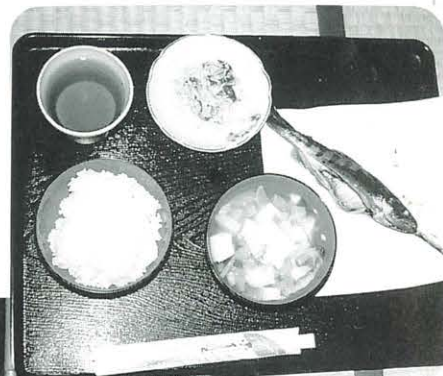
→ 和風の おいしい料理