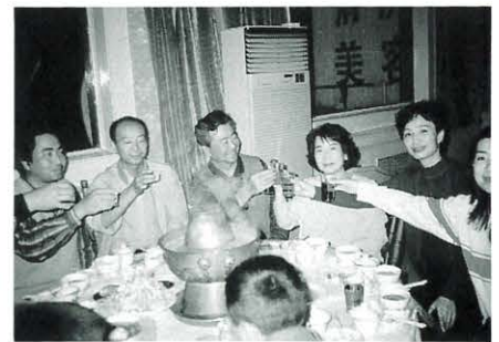
左から恵方、弟、恵文の父