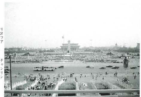
天安門から広場を望む