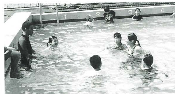
9月9日 魚梁瀬小プールおさめ・着衣水泳