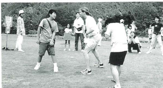
8月1日 山の学校体験入学