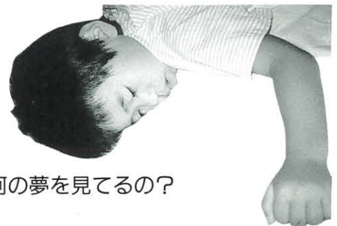
何の夢を見てるの？

とまで、それらすべてが子ども理解となって保母さんたちの実践へと帰っていきます。幸いなことに、保母さんたちのお便りを通して、一泊二日の子どもたちの様子が保護者の皆さんにも伝わったと思います。小学校入学前の子育ての再点検として、ご家庭での生活を振り返ってくだされば、保母さんたちの苦勞も報われるのではないのでしょうか。