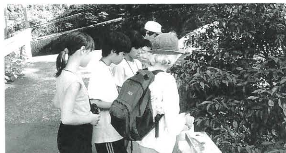
8月28日 ふるさとグリーンセンサス学習会