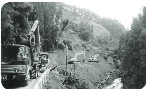
県道安田東洋線(馬路村中畑)の崩落現場

また、八百人近い応募者の受付を完了していた第九回おらが村・心臓やぶりフルマラソン大会は中止になった。けれども、村にはたくさん元気な人がいた。取材を通して、お年寄りから子どもまで、たくさんさんのチャレンジと