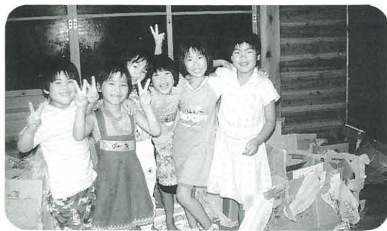
ダンボール箱で作ったおうちの前で