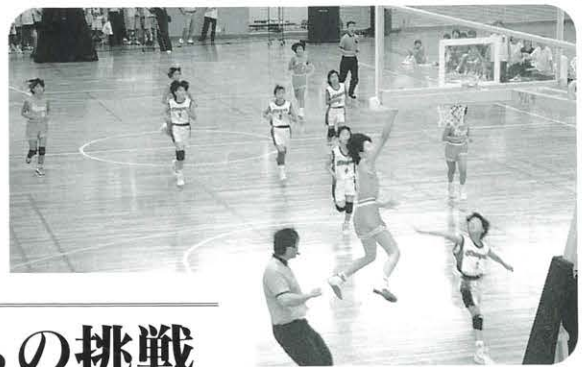
▲春野総合運動公園体育館