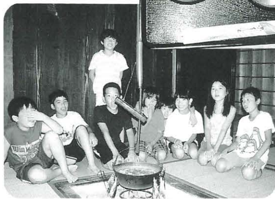
← いろりの前で 記念写真パチリ 「うおっ煙が…」