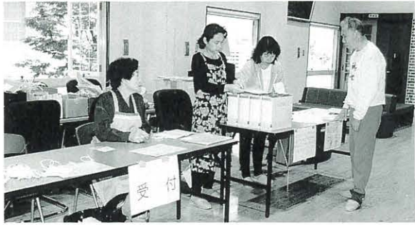
受けよう胸部検診 年に1回は!!