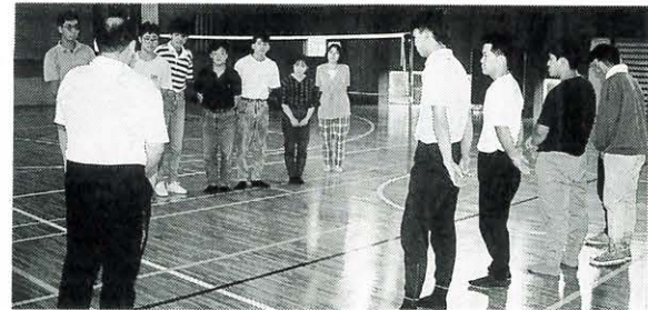
7月24日 青年団交流事業