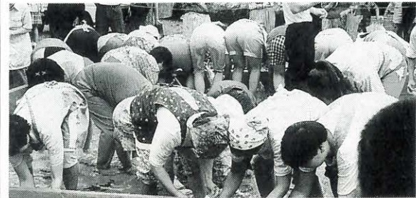
7月17日 フェスティバル魚梁瀬