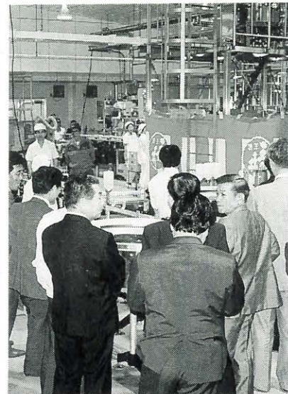
機械化と広くなった工場内(右)