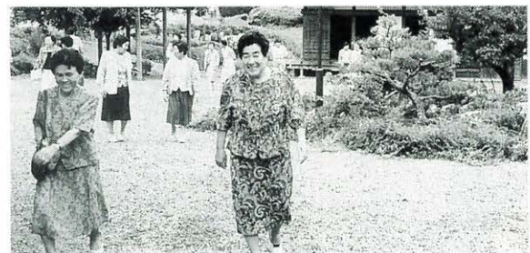
7月31日 婦人バス研修