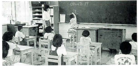
6月18日 魚梁瀬・馬路小低学年交流