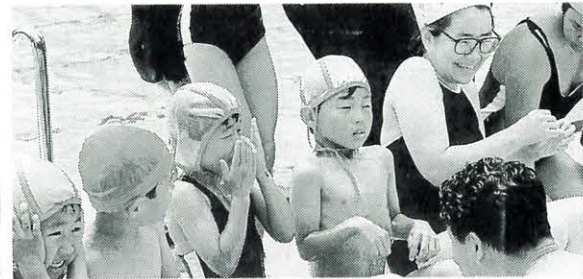
6月21日 馬小プール開き