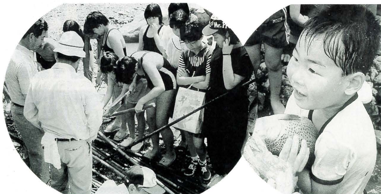
総なめスルスル大会