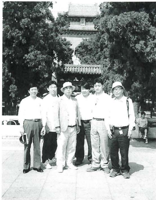
私を一人残して帰国した一行

カ月。待ちに待ったその日が来た。中国語のビデオテープや辞書を片付けて、一行(七名)の中に加わった。八月二十七日関空を出発。二時間後、上海着。(時差一時間) 初めての上海は、東京とあまりかわりなく、その夜は雑技団を観て終わる。テレビは英語、日本語、中国語の放映