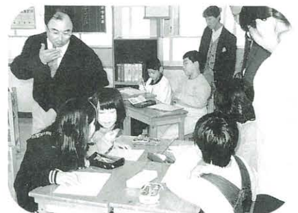
地域につくした先人について学ぶ4年生