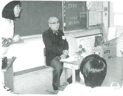
戦争の話をきく6年生