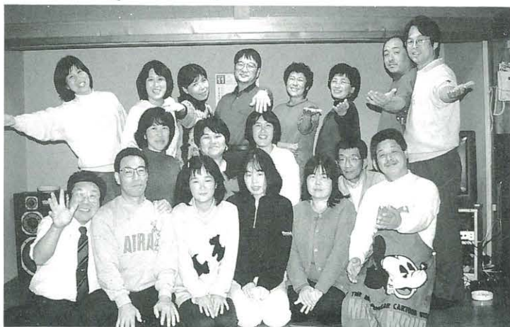
研究発表の日のアトラクションで 歌を披露したコーラスグループ