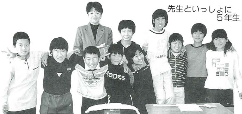
先生といっしょに 5年生