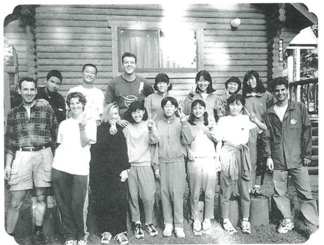
Halloween Camp participants make good friends ハロウィンキャンプに参加した仲間と共に