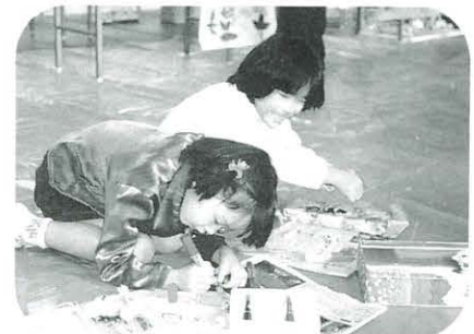
楽しそうにお祭りの準備をする1,2年生