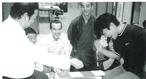
10月15日 魚梁瀬はし拳大会