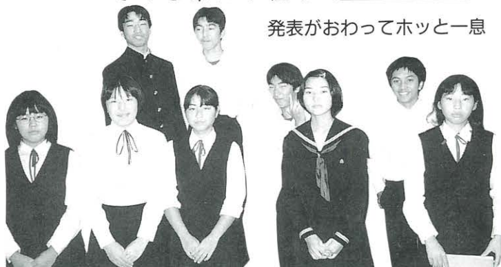
発表がおわってホッと一息

平成六年度からはじまる研究の足跡を読むと、真面目な反面、「受け身」的で指示待ちの多い子どもたちに、主体的に学ぶ力を培いたいという先生たちの熱意が感じられます。そして、子どもたちの多種多様な興味に対応して、支援する先生たちの労力も並大抵のことではなかったのではないのでしょうか。しかし、その中で「教える人」・「教えられる人」の垣根を超えて、共に学び合う姿勢は、魚梁瀬中学校の大きな財産となつて残ると思います。