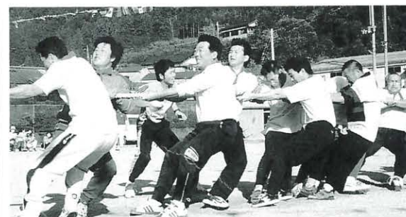
11月1日 馬路地区村民運動会