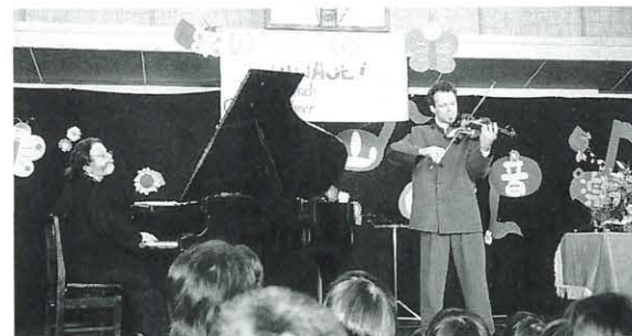
10月28日 リッチーパイラーク・ピアノコンサート