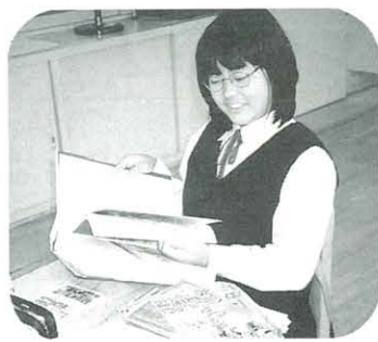
机の上は資料でいっぱい