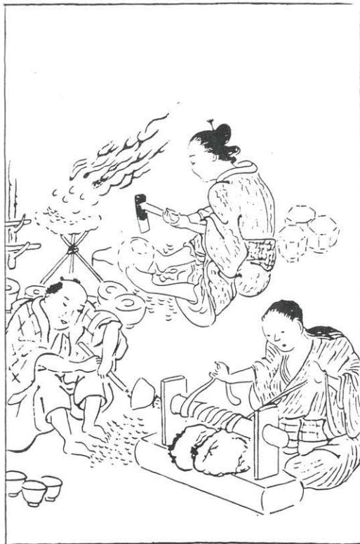
手まわしの口ク口を使って椀を作っている。

これらについては、今後も研究をつづけ、確実な資料が得られるなら、またの機会にご批判をいただきたいと思ふます。