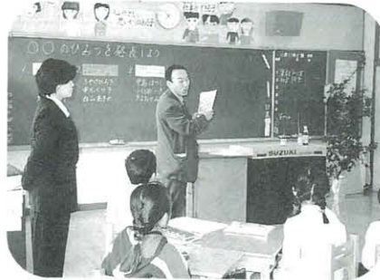
ゆず加工場の学習をする3年生