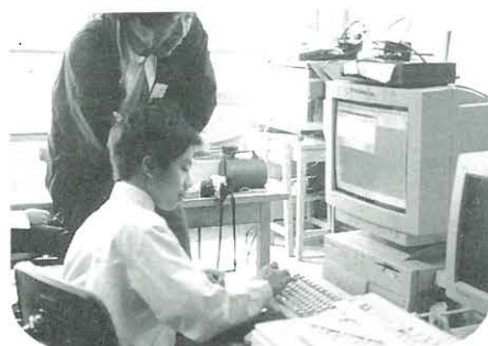
今やコンピューターは朝めしまえ