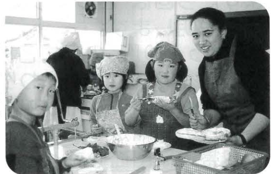
馬路小学校調理室でケーキを作る 12/15

馬路小学校の2年生はクリスマスリースや、ケーキを作ろうと誘いに来てくれました。ケーキはとてもおいしく出来上がりました。