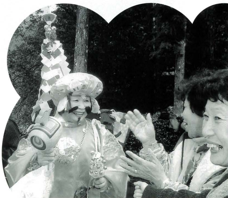
▲ 大黒さまに扮し見物客の笑いを誘う

この行事は、昔からお寺で続いている春のご祈祷の初会式で厄年の人はもちろん、みなさんの大難を小難に、小難を無難に、無病息災、所願成就等、もろもろの願いのご祈祷をするものです。