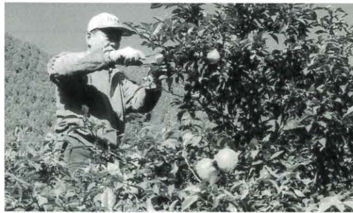
11月は柚子収穫の最盛期

これからはメインとなる 「ごつくん新工場」の建設や グリーンツーリズムを利用し た宿泊施設の改築に向け全力 で取り組んでまいります。