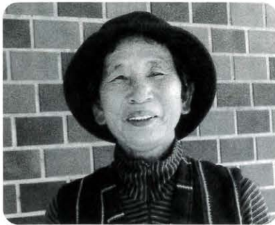
南 三子 （影）昭和7年生 盆、正月に、孫が戻ってくるのが楽しみです。