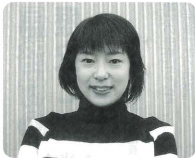
五百藏知代 (魚梁瀬) 昭和55年生 今年子どもも生まれるので、子育てに専念したいです。