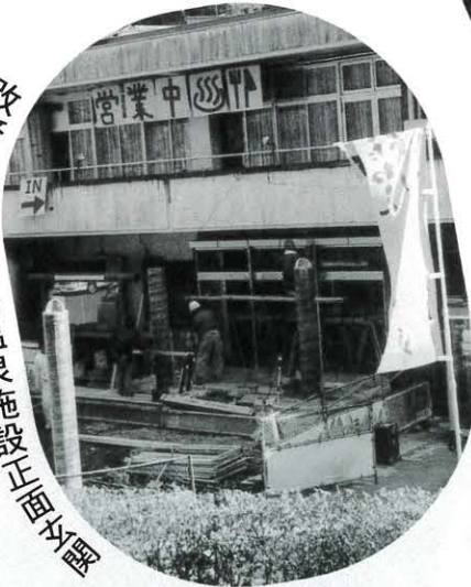
改修が進む馬路温泉施設土留工事