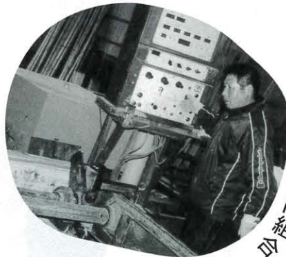
林材加工協同組合