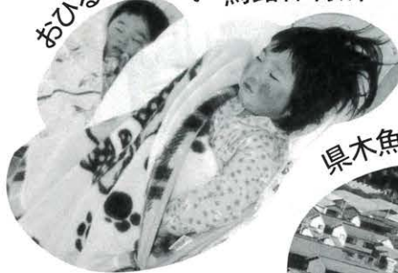
おひるねの時間 馬路保育所