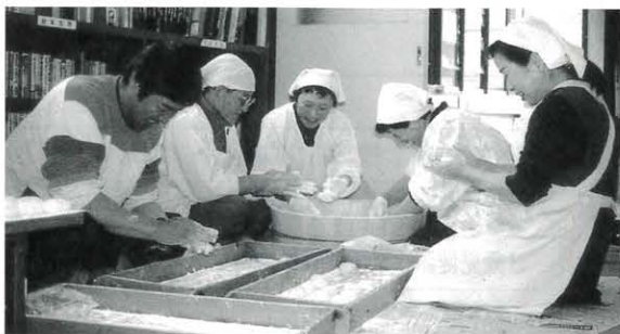
12月26日 福祉ふれあいもちつき