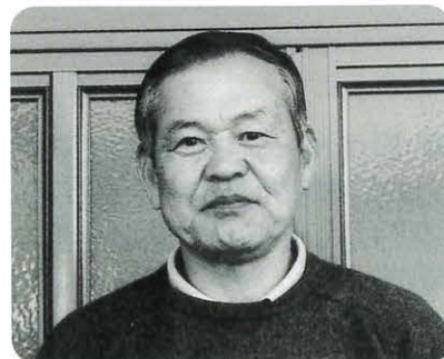
五百藏 尚 (魚梁瀬) 昭和19年生 息子の嫁も申年、生まれる孫も申年、三申そろえば良い事がありそうです。