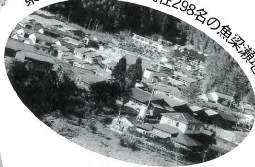
梟木魚梁瀬杉の里 現在298名の魚梁瀬地区