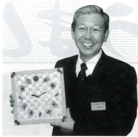
▲ エコアスの時計を手に