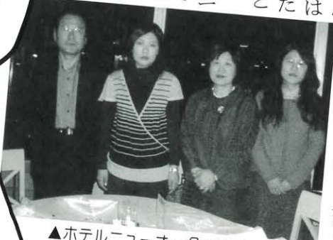
▲ホテルニューオータニにて夫と娘と共に 右から二人目が私

結婚を機に東京に出てきて早や今年で三十年になり、二〇〇四年を迎え、月日の経つ早さを実感しています。世間知らずののんびりした人間が、隣近所や会社の人たちに助けられながらここまでやってこられた事に感謝しています。三年前まで、『ごつくん馬路村の村おこし』の本の中にも登場する国分株式会社立川支店に十三年間勤務していましたが、事務所が遠くに移転したため、これを機に退職しました。