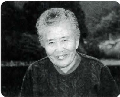
乾 亀 (影) 大正9年生 元気で畑ができ、孫の行く末を見守 れたらと思います。