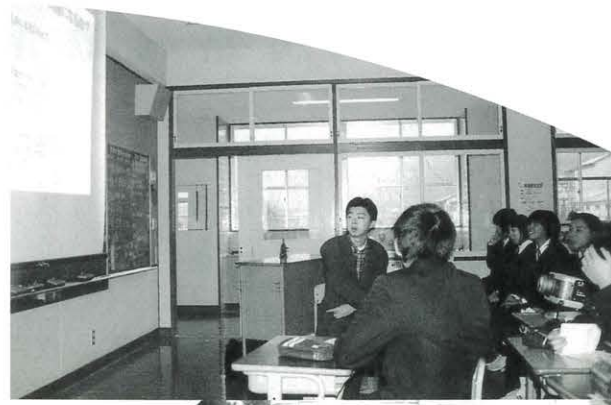
骨粗しょう症についての話を熱心に聞く生徒たち

密度はほぼ最大になるので、この時期に自分の骨密度の値を知ることは病気の予防に役立つことになること。また、骨の発育には、成長期の食生活・運動習慣が最も大切で骨密度は20歳を過ぎるころから減っていき、特に女性は