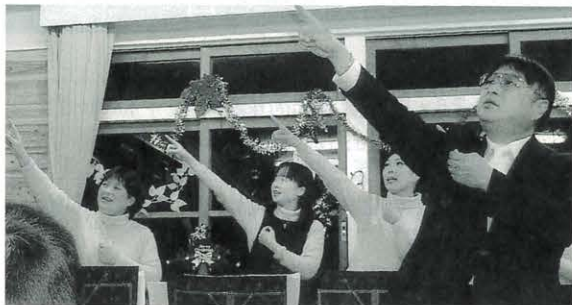
12月13日 ハミングゆ〜ずクリスマスコンサート