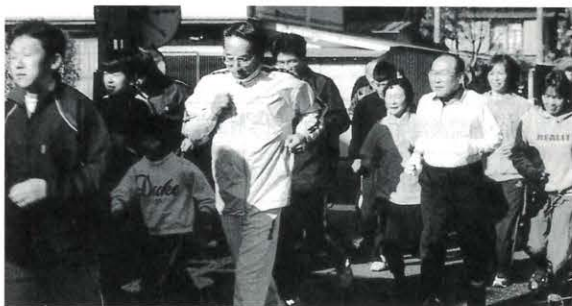
1月1日 新春走り初めピットリタイムレース(魚梁瀬)