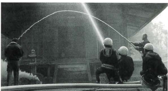
1月26日 金林寺防火訓練