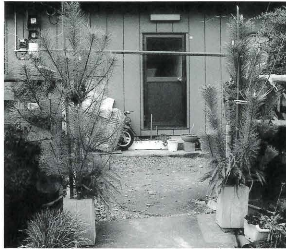
清岡節夫さん宅 (相名) の門松。お孫さんの誕生を切っ掛けに門松を復活させたそうだ。右側に雄松、左側に雌松を飾っている。馬路の山には雄松が少なくなり、両方飾っているのは珍しい。