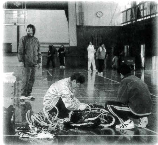
ちよいボラ開始直後、もつれているネットを直したり、どのように掃除を進めていくか検討している（馬路体育館）