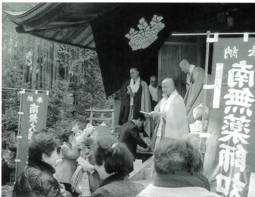
▶ 厄よけのご祈祷の札を受ける人たち (金林寺薬師堂にて)

今年は申年です。古くは『続日本書紀』（養老五年・七十二年）より、「申年は凶年である」と言い伝えられてきました。しかし、縁起かつぎでいえば、申年は互いに知恵を出し、和やかに楽しむ年でもあるそうです。 みなさんの健康とご多幸を祈って、馬路の新春に福を呼ぶ「お薬師様の厄よけ大法会」と「門松」を紹介します。