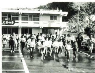
↑馬路体育会はしりぞめ風景