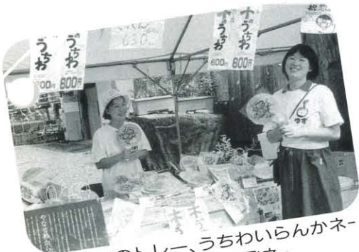
エコアスのトレー、うちわいらんかネー えい香りがするぞネー