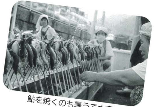
鮎を焼くのも暑うて大変