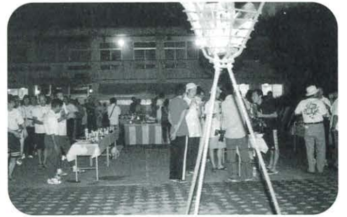
前夜祭、和気あいあいと話がはずむ