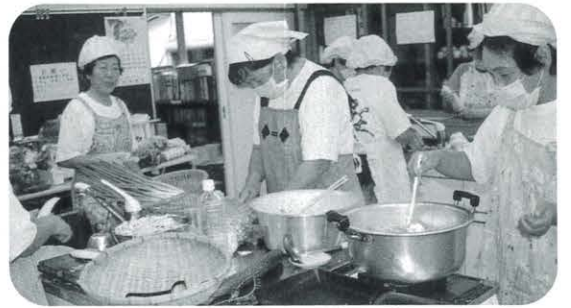
ちやくちやくと美味しい料理ができあがる