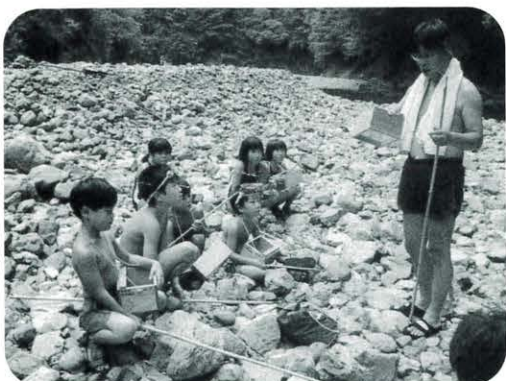
奈半利川(石仙) 水辺の楽校