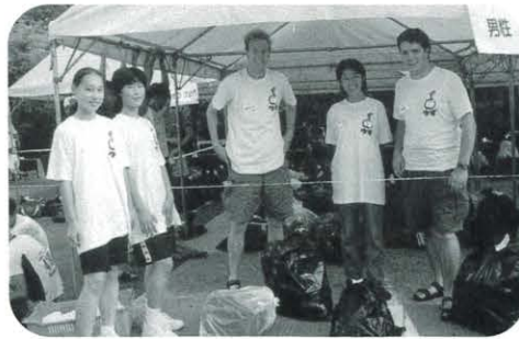
国際交流員も中学生といっしょにボランティア