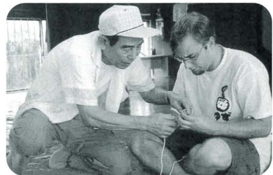
日本の昔あそびを教えてもらったよ。