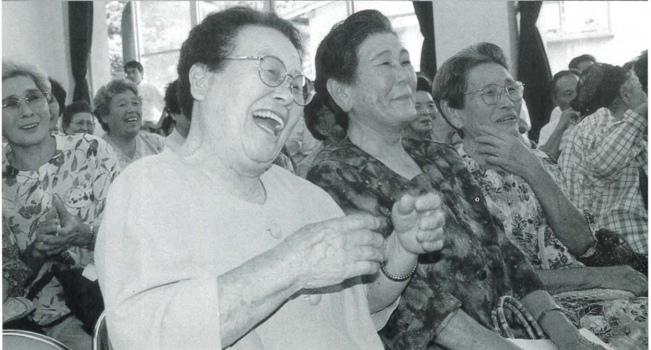
アラ！まあ見て！笑いころげて・・・（就業改善センターで）