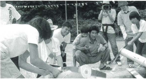
7月28日 魚梁瀬山の学校体験入学