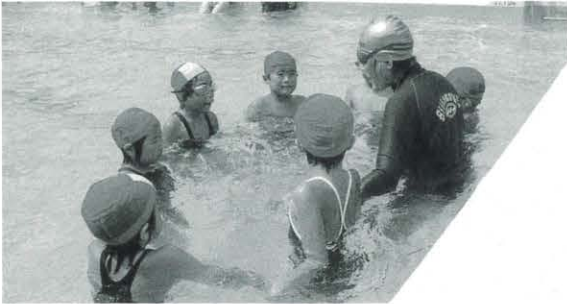
8月7日 親子水泳教室(馬路)