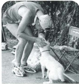
しばし犬とのふれあい