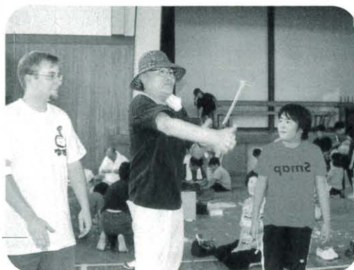
馬路小 敬老参観日