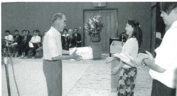
9月12日 敬老会(魚梁瀬地区)