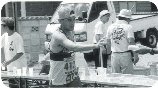
スポンジでバトンタッチ

九月九日、今年もやはり台風に悩まされた「第 十回記念おらが村心臓やぶりフルマラソン大会」 でしたが、天は頑張っている馬路村にエールを 送ってくれたのか上天気となりました。