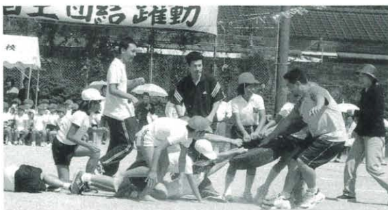
9月23日 保・小・中学校運動会(馬路地区)