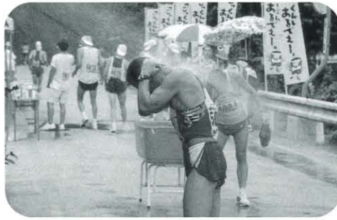
シャワーのサービス