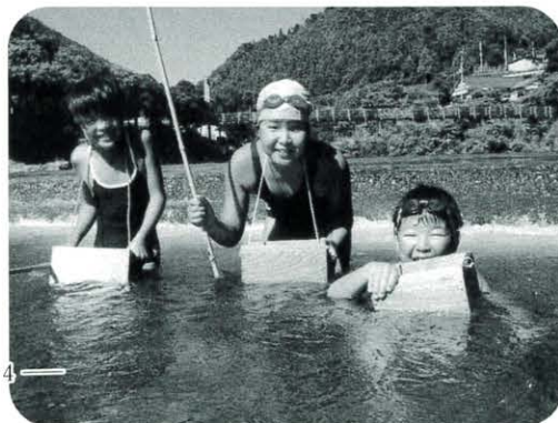
安田川 水辺の楽校