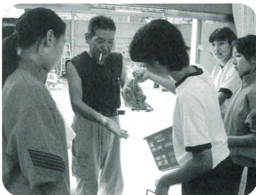
馬路中 農園収穫・販売