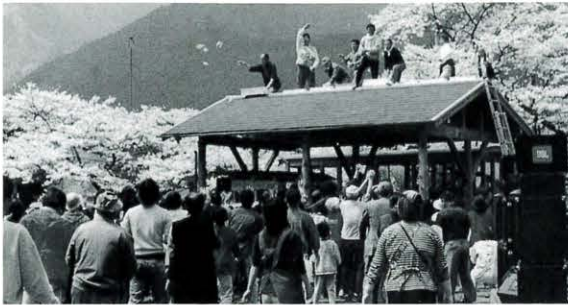
4月9日 魚梁瀬桜まつり