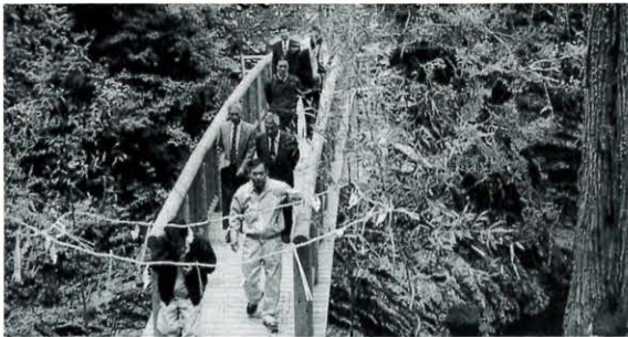
4月27日 太鼓橋渡り初め式