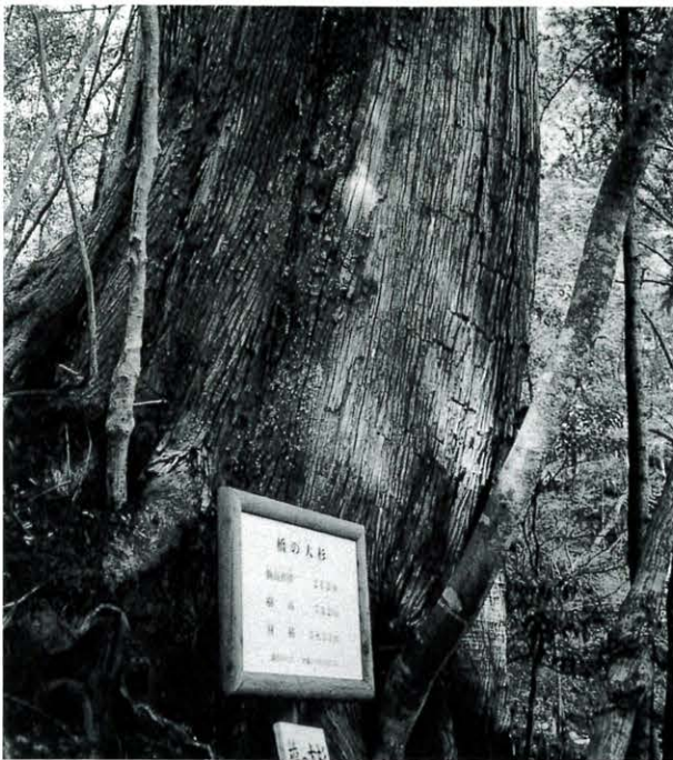
橋の大杉(千本山登山口)

歌人、劇作家、東京に生まる。 歌集、戯曲など独自の境地を開いた。西村時衛著「吉井勇の土佐」は土佐における勇がよく書かれてる。 注二、「流灌頂、千体地藏流し」のくわしいことは「馬路村の歴史」と伝説」を見て下さい。