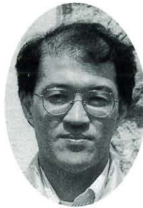
高屋 敷元 木