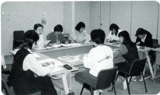
健康福祉課と養護教諭の熱心な話し合い

保健関係の人から専門的な支援を得ることで、学校での性教育を効果的に実施していくことは、十代の妊娠中絶率が高い高知県にとって、大きな意味があります。それは、高校生になると、多くが村外で暮らす村の子どもたちにとっても大切なことなのです。