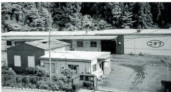
5月15日 ニチフ端子高知工場閉鎖