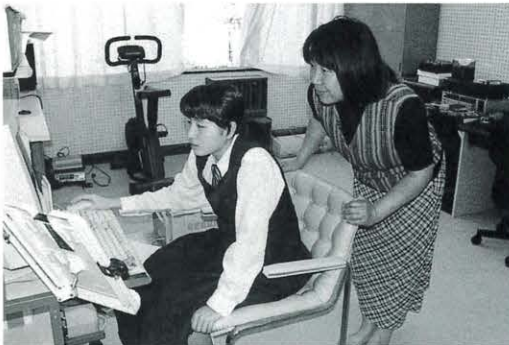
コンピューターのインターネット で各自での情報を探す

くりを模索し、生徒のニーズに答えなければ、生徒は教室にいないという点で、先生も厳しい選択をしたといえますが、先生と生徒がともに学ぶ授業が展開できそうです。