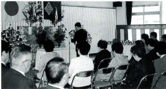
5月10日 戦没者追悼式