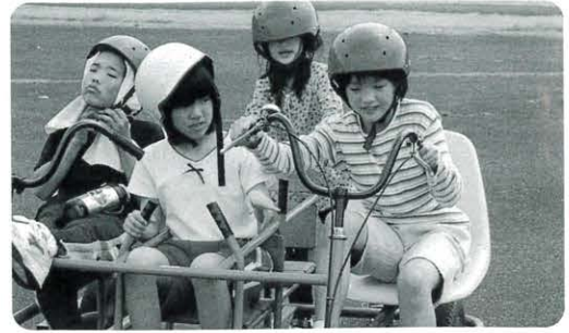
宿泊訓練でいっしょに遊ぶ子どもたち

子どもの数が少ないことから生ずるさまざまな問題点を克服する一つの手段として、馬路小と魚梁瀬小は交換学習会を実施しています。五月十七、十八日には、馬路小と魚梁瀬小の四年生が室戸少年自然の家で宿泊訓練を行いました。今年、室戸少年自然の家が新しく導入した「シーカヤック」(海で乗るカヌー)にチャレンジするなど、山ではできない体験もできました。少人数の問題は、外様な友人にふれあう機会が少ないため、人間関係が固定化してしまいます。学校だけでなく、地域や家庭でも、大人の人間関係づくりも含めて、考える必要があります。