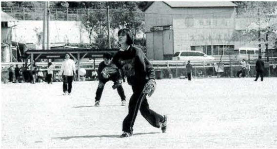
4月8日 職域ソフトボール大会