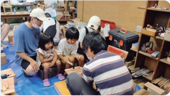
8月11日 木工教室(うまじ工芸センター)