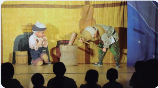
8月29日 劇団バク人形劇(馬路村集会センターうまなび)