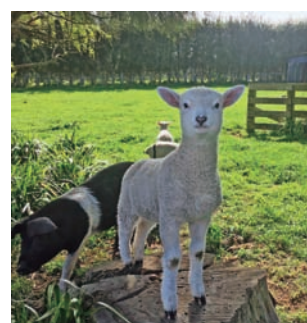
▲ニュージーランドの有名な動物といえば「羊」