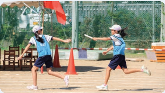
9月16日 馬路保・小・中合同運動会(馬路村民運動場)