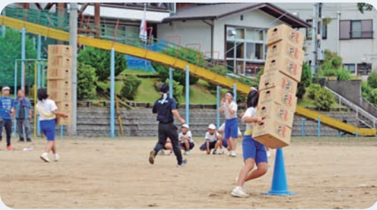
9月23日 魚梁瀬保・小・中合同運動会(魚梁瀬運動場)