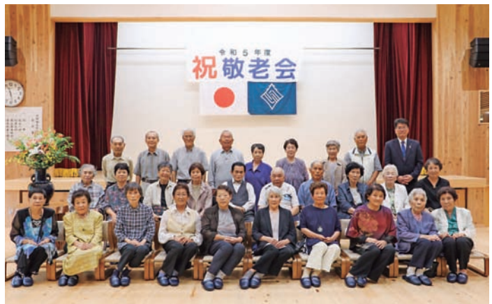
▲式典後、ご参加いただいた皆さまで記念写真を撮影しました（右：馬路会場 左：魚梁瀬会場） ご参加の皆さまには、記念写真を現像し、ご自宅にお届けします