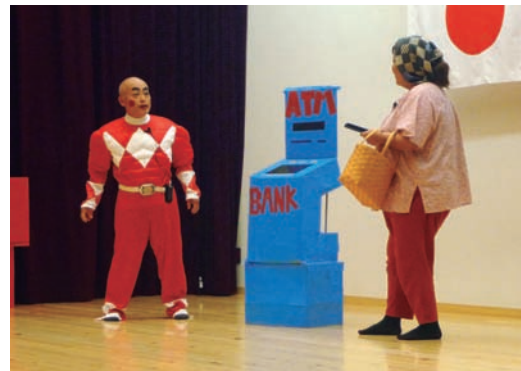
▲特殊詐欺について楽しく学びます