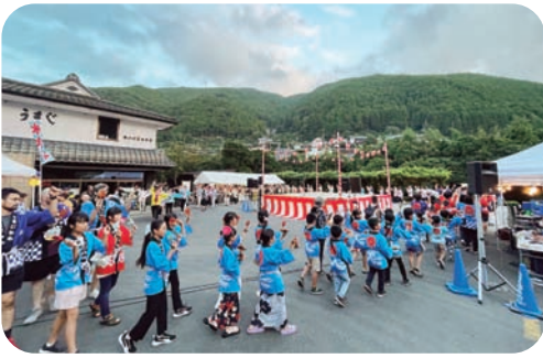
▲会場みんなでよさこい踊り

役場前から、村内事業所や保育・小中学校等、7チーム総勢119人によるよさこい踊りの行進を皮切りに、輪踊りやもち投げ、舞台演芸、富くじ抽選会が行われました。