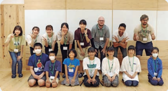
8月14日～16日 半熟たまご塾(馬路村集会センターうまなび)