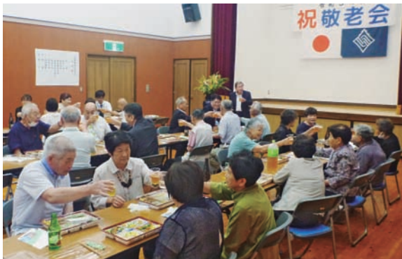
▲長寿を祝して、乾杯！