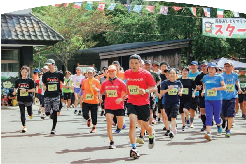
▲馬路温泉前を一齐にスタートするランナーたち

12府県から参加していたいただいた総勢174組のおしどり夫婦と、6組のカップルは、後になったり、先になったり、仲良く村内を駆け抜けました。今年はお2人合わせて47歳という若い夫婦から、169歳のご長寿の夫婦までさまざまな年代のかたがたが、仲睦まじく手をとりあってゴールされていました。また、来年も変わらず仲良くご参加していただけることをお待ちしております。