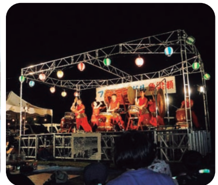
▲「一響館」龍による見事な和太鼓