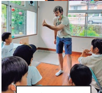
ルイジの異文化交流