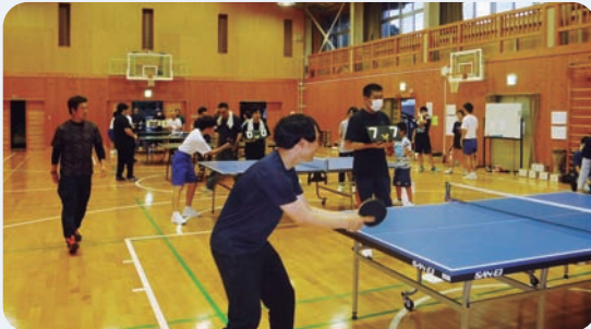
7月11日 魚梁瀬地区卓球大会(魚梁瀬体育館)