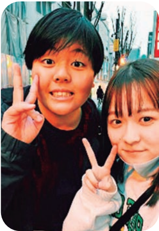
▲私(左)と馬路の商品が好きな友達(右)

地域おこし協力隊として2年目になりました。魚梁瀬にも慣れ、住民のかたがたにも顔を覚えていただき、手を振ってくれる方もいて、毎日楽しく充実した生活を送れています。 1年目はコロナの影響で交流会やイベントも縮小していました。2年目になると交流の機会も増えてきてたくさん参加をさせていただけます。 1年がたち、私はたくさんのご経験を、できることが増えました。指定管理施設のキャンプ場では、ブローヤや芝刈り機が使えるようになり、また受け付けや電話対応もできるようになりました。森林鉄道でも、電話対応以外にベテランの方に横についてもらって森