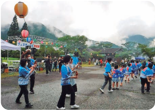
▲いつものようによさこい鳴子踊りでスタート!

7月22日(土)午後5時からフェスティバル魚梁瀬が開催され、いつもは静けさに包まれている丸山公園が大いに賑わいました。