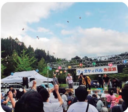
▲夢中で拾う、もち・菓子投げ