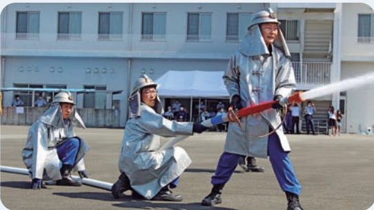
7月23日 中芸消防大会(田野町)