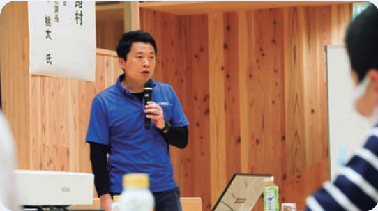
6月14日 キャリア教育講演会(馬路村集会センターうまなび)