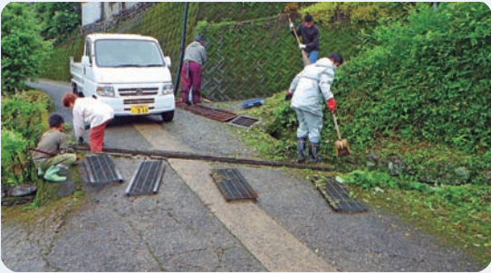
6月11日 村内一斉清掃