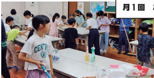
月1回 お掃除タイム

昔遊びや、ものづくり、行事イベントなどお手伝いできる地域の方は、お気軽に子ども教室に遊びに来てください。