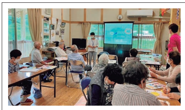
相名会館での講義の様子

今年度中に各地区で第2回を実施予定ですので、興味のある方は、健康福祉課までご連絡ください。次回は、1月を予定しています。