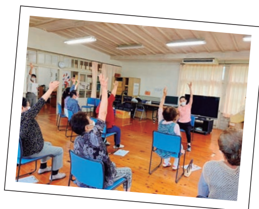
交流センターでの体操の様子