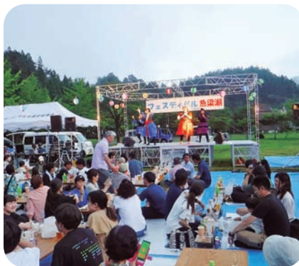
▲魚梁瀬ふるさと劇団杉ぼっくりのショー